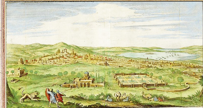
Représentation de Tunis au milieu du XVII e siècle. (Anonyme 1646)