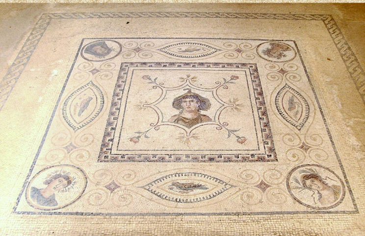
Maison Africa, Musée El Jem, IIe siècle après J.C.